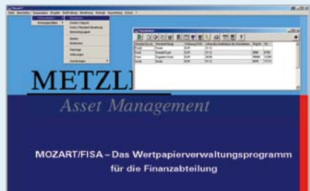
Beispiel 5: Flexible Datenstruktur